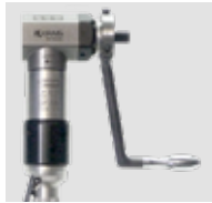
Manivela con recorrido de doble alimentación.