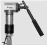
Palanca de alimentación.