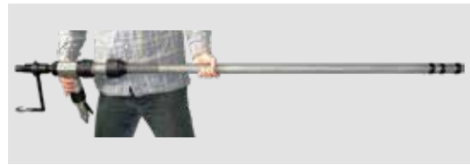
Narzędzie 3WTTC może mieć do 5 m (na zamówienie).