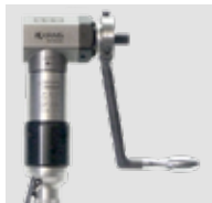
Korba z pojedynczym posuwem