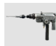
MOTORES DE EXPANSIONADO → CAPÍTULO PÁGINA 36