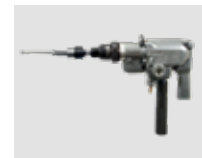
MOTORES DE EXPANSIONADO → CAPÍTULO PÁGINA 36