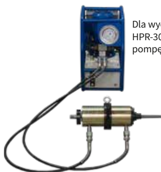
Dla wyciągacza HPR-30 zalecamy pompę CPPZ-1000