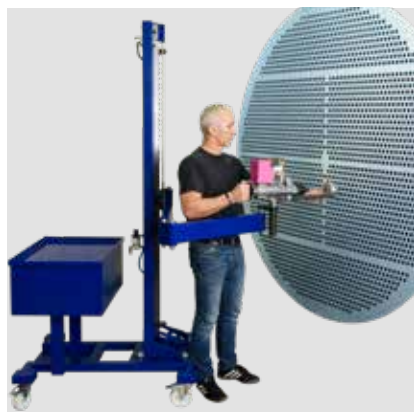
Auto K60 zamocowane na ramieniu Flexpander.