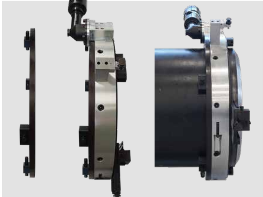
SFSF-1624 con ORR montado en tubo de 24" sch 10.

Para aplicaciones superpesadas con paredes supergruesas y/o tubos de aleación dura, considere nuestro ORR para mejorar la estabilidad axial y radial. Fabricamos el anillo de acero ORR, que se monta en la parte trasera del anillo de aluminio. El ORR esta también equipado con 4 estabilizadores de acero que mejoran el rango y la rigidez de la máquina en aplicaciones pesadas. El ORR incrementa de manera dramática la estabilidad axial y la rigidez durante las operaciones de corte y/o biselado. Esta solución puede ayudar a ahorrar tiempo y gastos para clamshells fabricadas completamente en acero - pregunte a nuestro representante para más detalles.